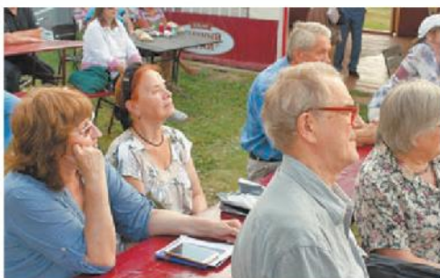
ФОТО: ПАМЯТИ ПОЭТА АНАТОЛИЯ ВЕТРОВА/К.СКО

– Стихи, песни, хорошие люди... Этих встреч каждый раз я жду с нетерпением, – говорит он.