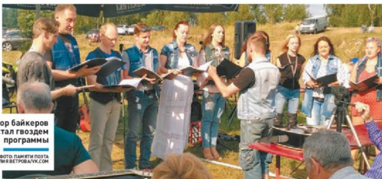
Хор байкеров стал гвоздем программы